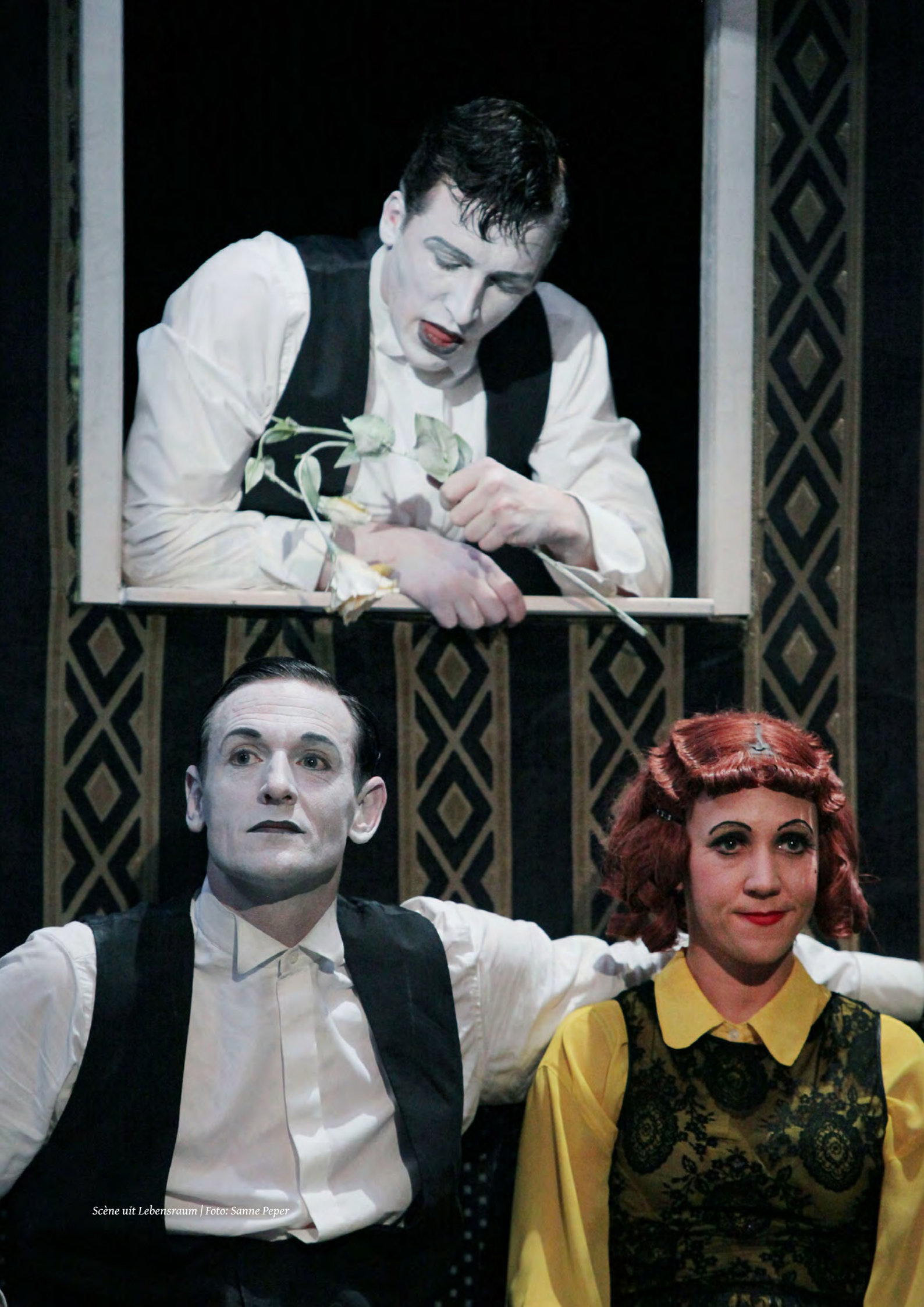
Scène uit Lebensraum