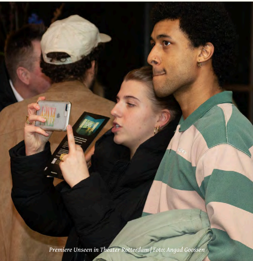
Premiere Unseen in Theater Rotterdam