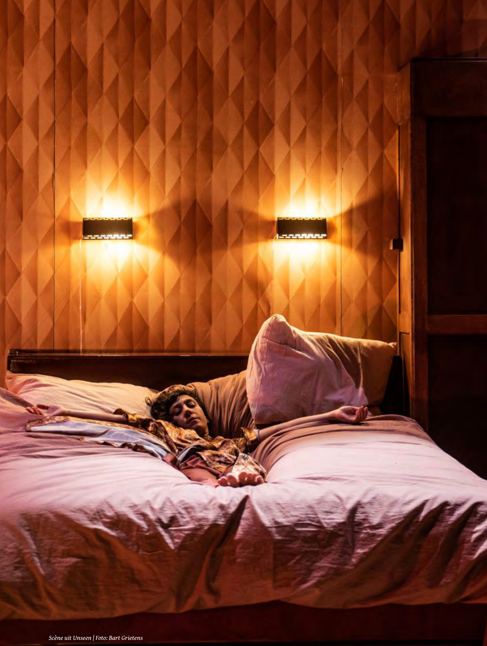
Scène uit Unseen