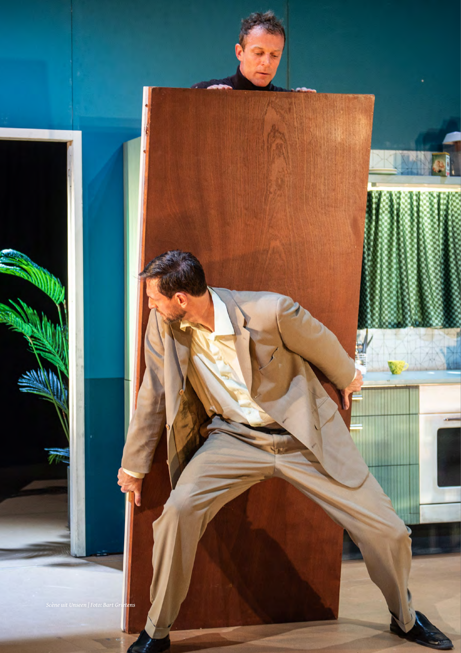
Scène uit Unseen | Foto: Bart Grietens