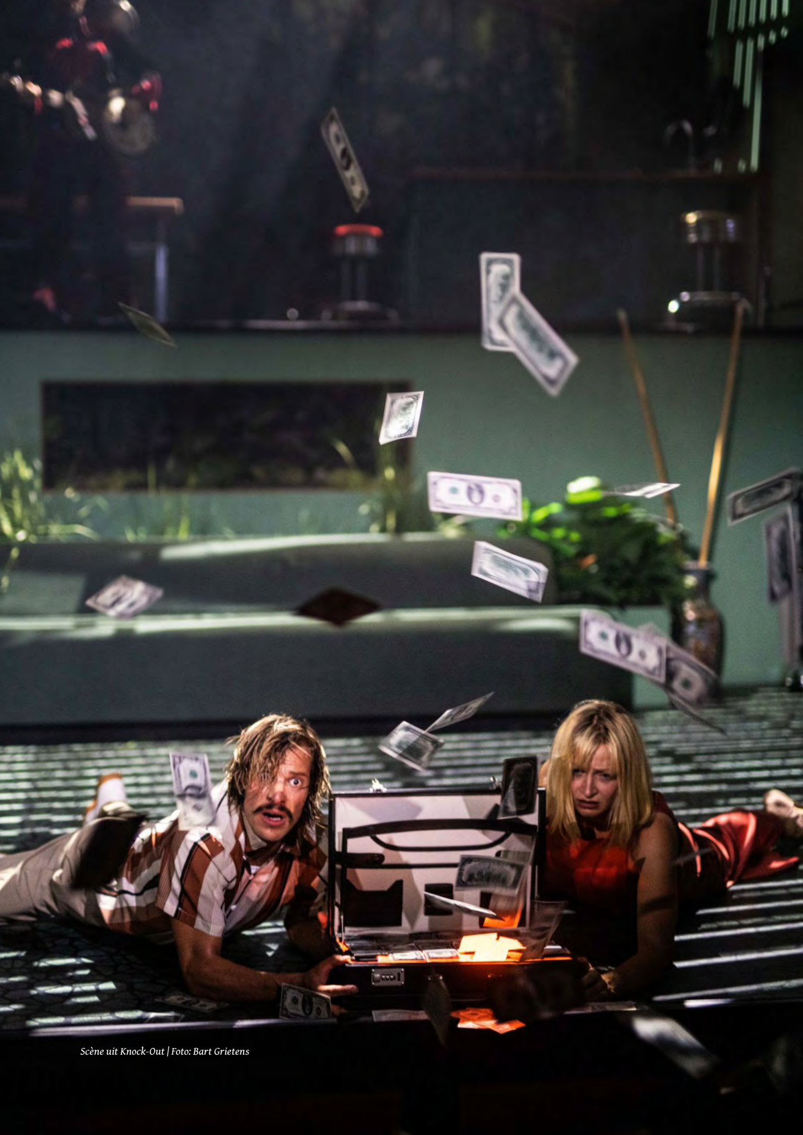
Scène uit Knock-Out | Foto: Bart Grietens