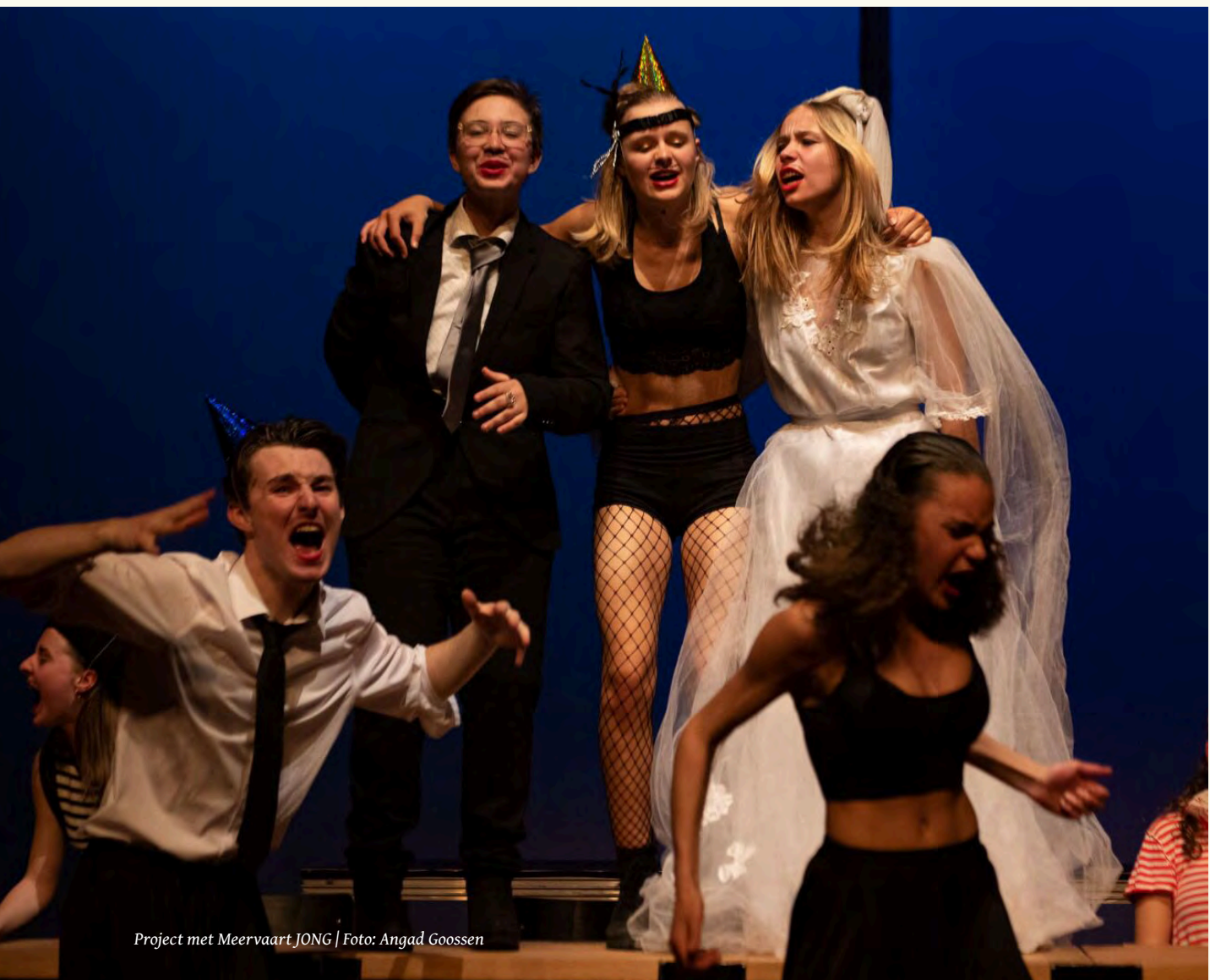
Project met Meervaart JONG