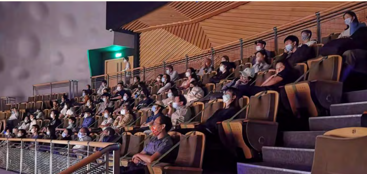
Offline screening Vielfalt Shanghai, Dutch Dance Focus

Bij vacatures en casting wordt specifiek stilgestaan bij diversiteit. Dat geldt ook bij het ontwikkelen van nieuw repertoire.