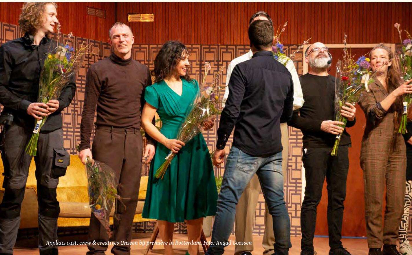
Applaus cast, crew & creatives Unseen bij première in Rotterdam.

Unseen is genomineerd voor de VSCD Mimeprijs en geprogrammeerd in het Theaterfestival. Helaas kon de voorstelling daar niet gespeeld worden doordat een van de spelers covid-19 had.