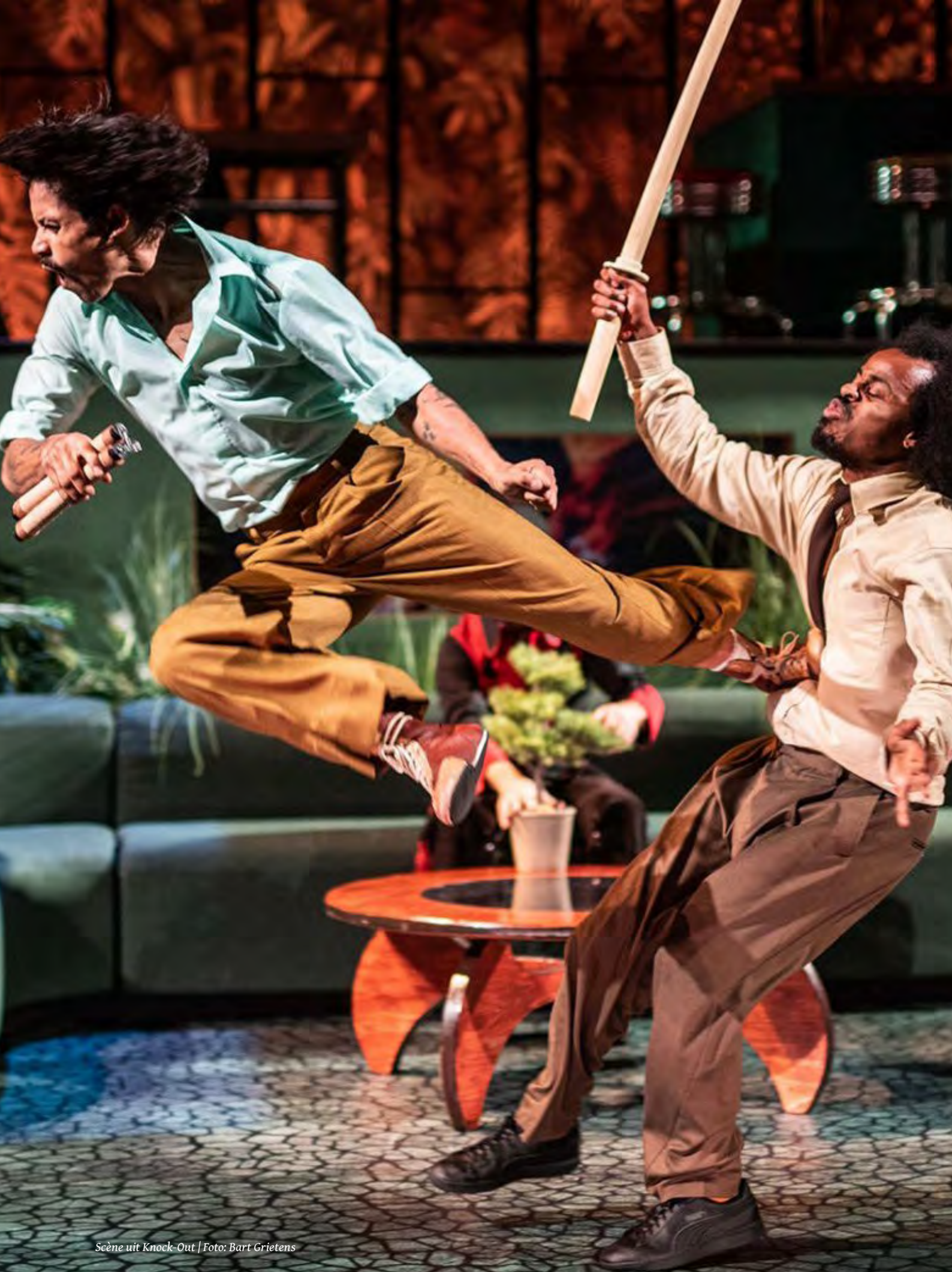
Scène uit Knock-Out | Foto: Bart Grietens