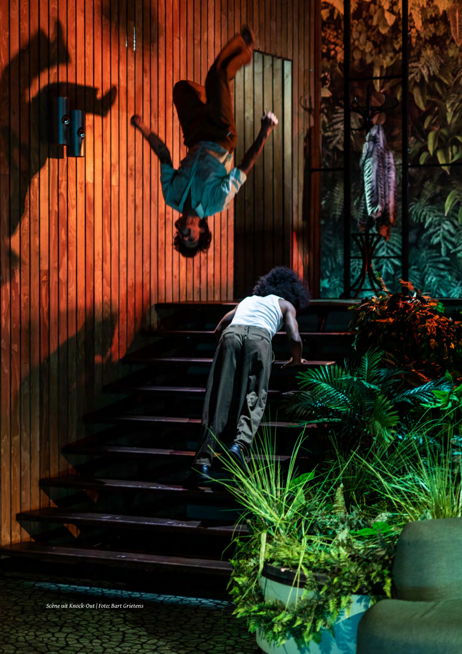
Scène uit Knock-Out